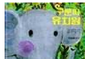
ぐるんぱのようちえん